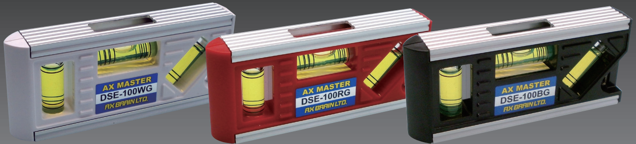
DSE-100WG 本体:ホワイト (マグネット付) 気泡管:グリーン

ボディカラーと気泡管カラーが選べます!! (ホワイト・レッド・ブラック) (グリーン・ブルー)