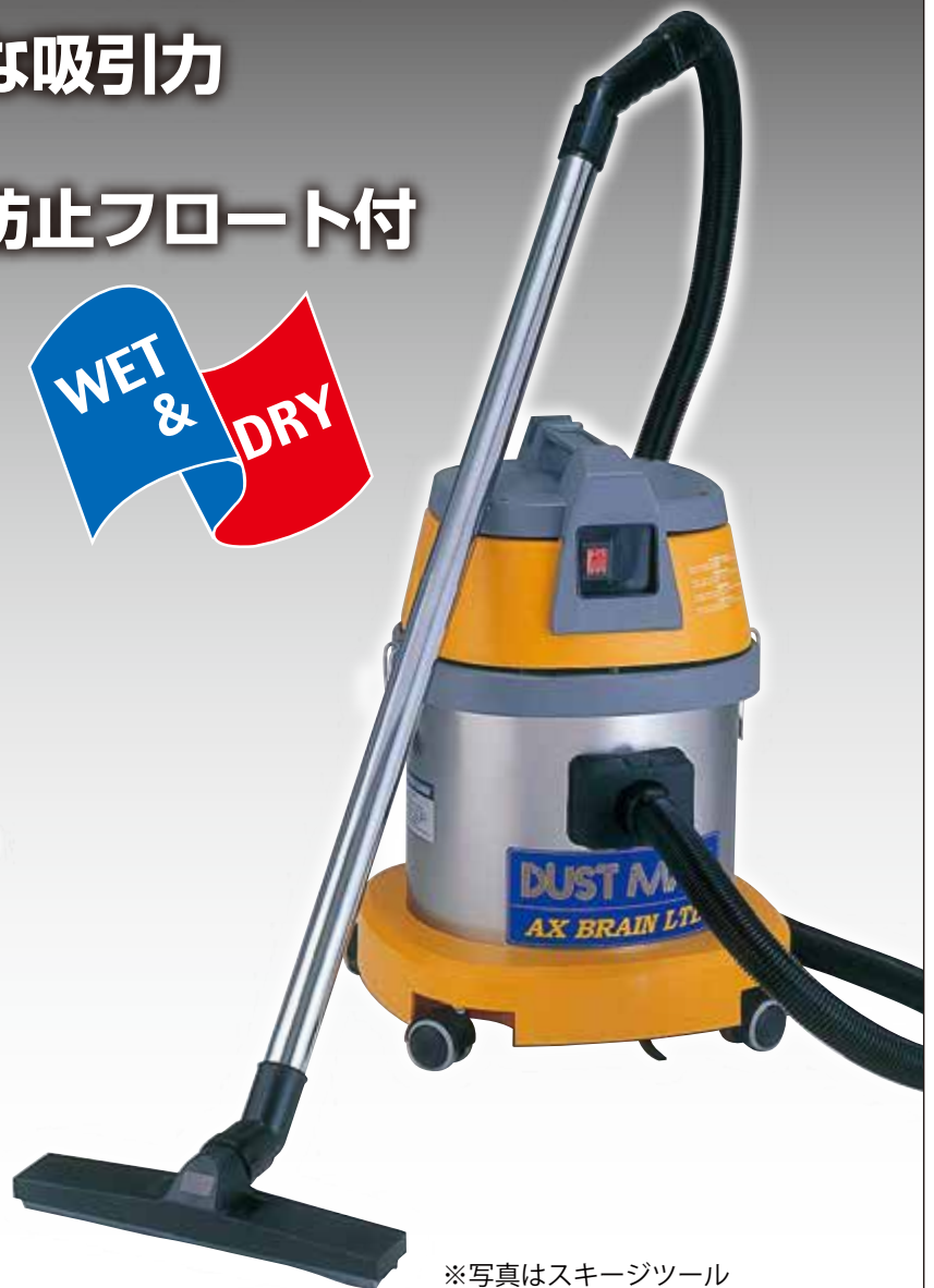
※写真はスキージツール