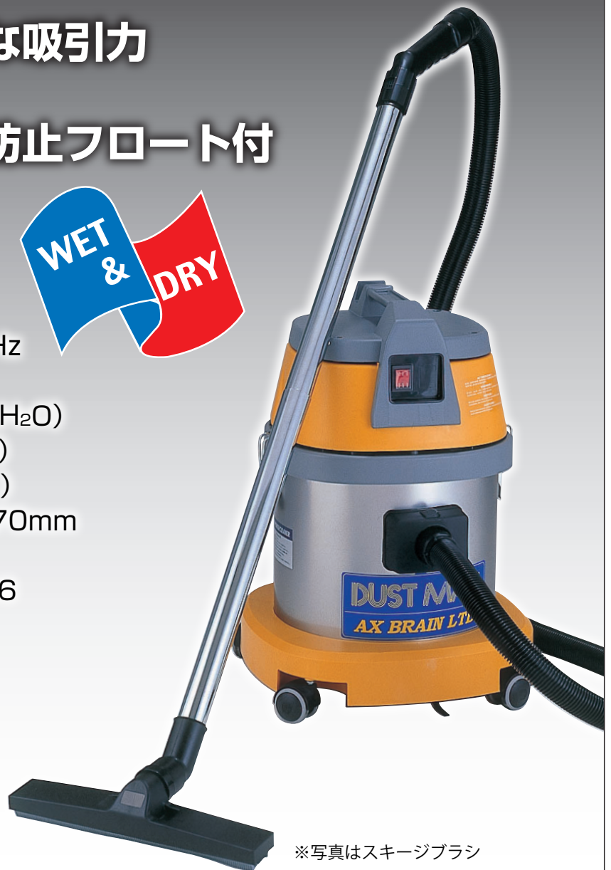
※写真はスキージブラシ