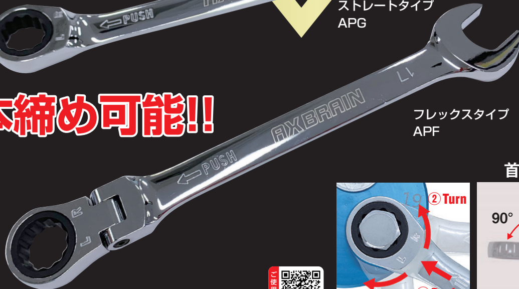
フレックスタイプ APF