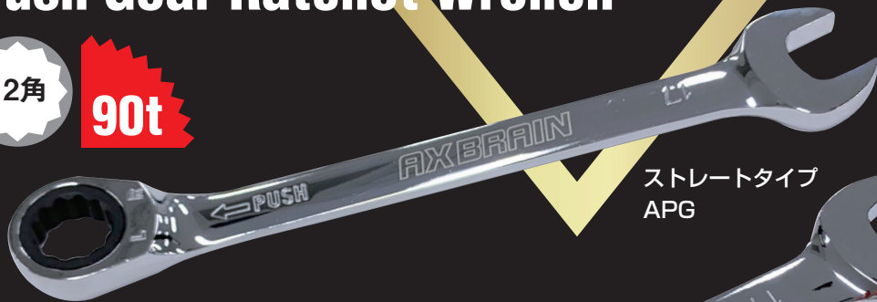
ストレートタイプ APG