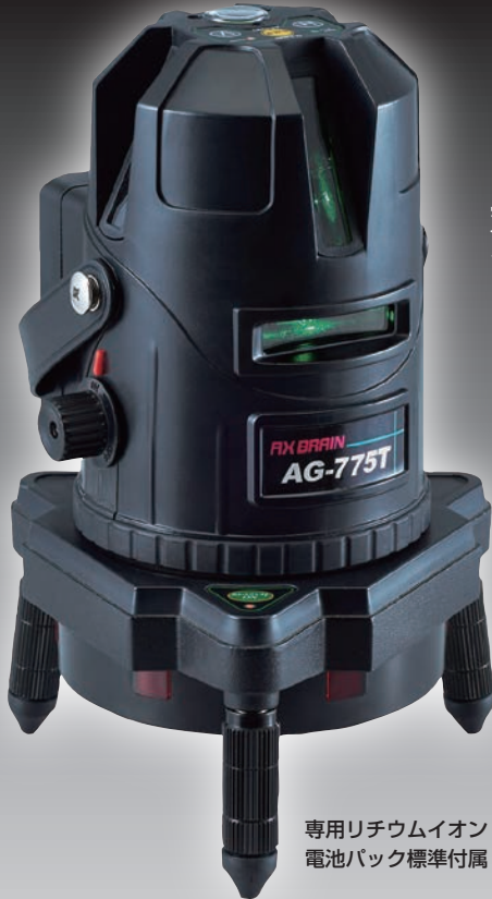
専用リチウムイオン 電池パック標準付属

専用リチウムイオン電池パック対応!! 自動探知機能搭載のダイレクトグリーンレーザー墨出し器!!